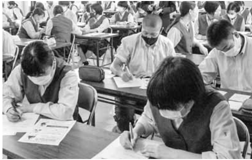
山田町育英会は、子どもたちが安心して学べる環境づくりを目指して活動しています

◆申込先・問い合わせ 山田町育英会事務局(町学校教育課内・内線313)へどうぞ。