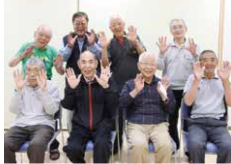
さわやか健康教室に参加する皆さん。調理実習の再開を楽しみにしています

◆申込先・問い合わせ ▶①～③…山田町地域包括支援センター（☎82-3136）▶④…山田町社会福祉協議会（☎82-3841）へどうぞ。