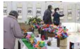
昨年の町民芸術祭・展示部門

10月に開催する町民芸術祭への作品出展者や舞台出演者を募集します。奮ってご応募ください。