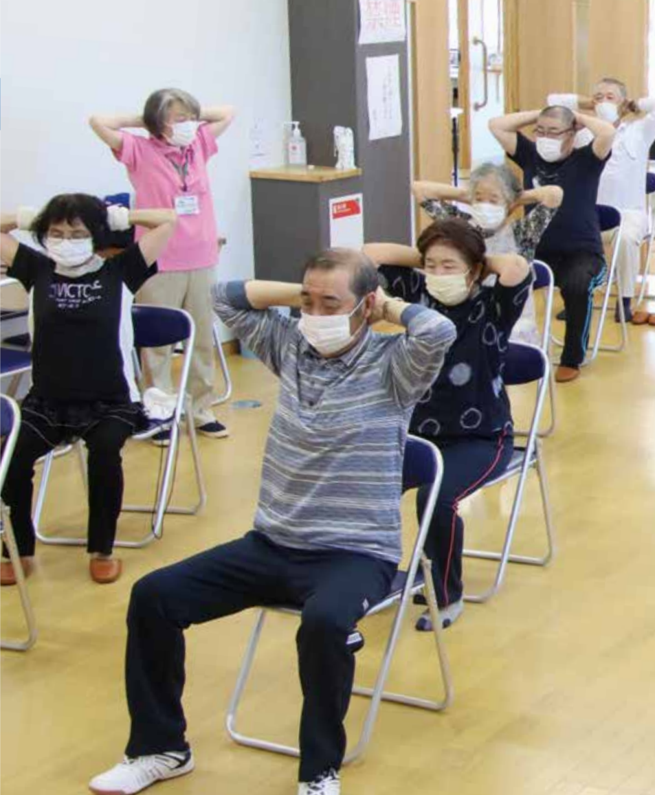
指導員とともにシルバーリハビリ体操で上体のストレッチをする「ゆうなご会」の皆さん

老後の不安を社会全体で支え合う介護保険制度。町は、平成12年4月の制度開始から介護保険事業計画に基づく各種サービス事業に取り組み、今年4月に第8期介護保険事業計画（計画期間・令和3年度～5年度）をスタートさせたところ。今後の予測では、75歳以上の後期高齢者などの割合が急増すること、要介護（支援）者の増加が見込まれ、令和22年度には人口の約半数が高齢者となり、現役世代の減少に伴う介護の担い手の減少が懸念されています。今号では、介護保険事業の現状を見詰めながら、私たち町民一人一人が支え合い、安心して健やかな日常生活を送るために今、必要なことは何かを考えてみます。