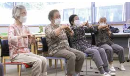
握力アップの体操を行う「さいかち学級」参加者の皆さん

山田町人口ビジョンでは、令和22年の人口規模を1万2000人程度と推計しています。令和7年には「団塊の世代」が75歳