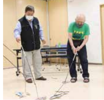
教材を使ったレクリエーションに取り組む皆さん