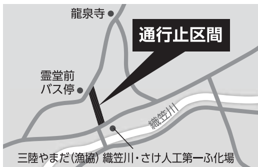
◎町道礼堂線通行止め箇所