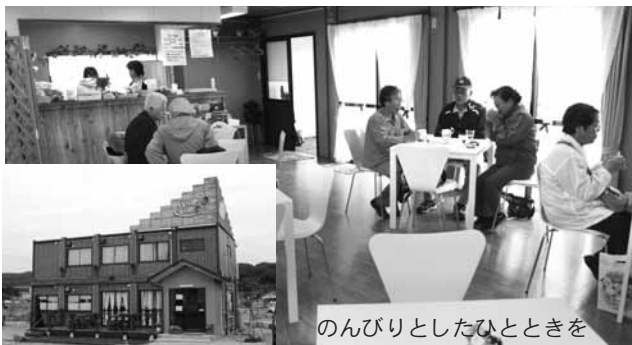
のんびりとしたひとときを

避難所や仮設住宅などで移動カフェを行い、支援を続けてきたOMF岩手支援プロジェクトでは、川向町に交流ぶらざ「いっぽいっぽ・山田」を開設しました。施設内には、自由に読むことができる本のコーナーやリーズナブルな価格で飲み物なども用意されています。一人でのんびりしたい人やグループで楽しく過ごしたい人など、お気軽にお立ち寄りください。