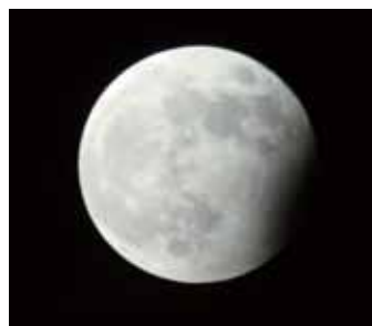
6月4日の月食を撮りました。終わりかけですが…。

海と緑の美しさ 海のカレキ作業してくれた陸上・海上自衛隊さん、他の工事の方々、警察の方々、住民のみ