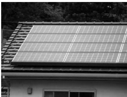
設置を予定している人はご検討を

町では、町内における再生可能エネルギーの普及促進を図るため、国の補助金を受けて住宅用太陽光発電設備を設置した方に対し、設置費用を補助します。8月1日から補助金申請の受け付けを開始します。詳しい申請方法や必要な書類については、お問い合わせください。 ▽対象者 次の①②③にすべて該当する人が対象となります。 ①町内に住所を有する人(法人を除く) ②国の補助金を受けて太陽光発電設備を設置した人 ③町税に滞納がない人 ※この補助金は1人1回、1棟