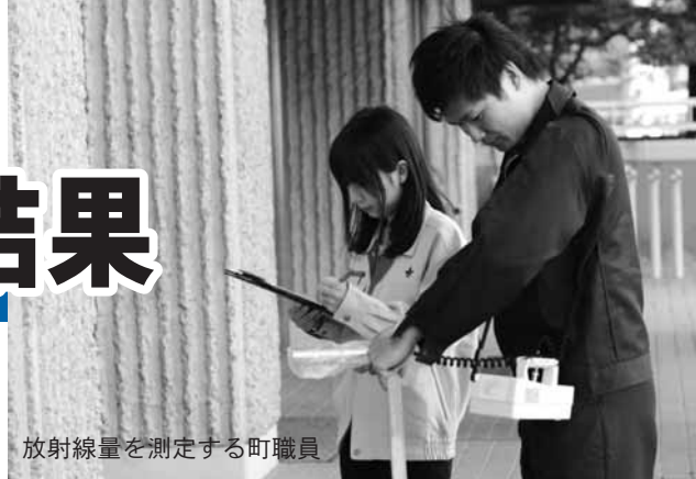
放射線量を測定する町職員

測定は、小中学校12カ所、幼稚園・保育園などの保育施設11カ所、各地区の集会所など41カ所の計64カ所で敷地内の代表的な地点を中心に行いました。測定には、空気中のガンマ線から放射線量を測定するシンチレーション式サーベイメータを使用。基準点を決めて、5点測定をして平均を測定値として算出しました。測定の高さは、小・中学校やその他施設を1m、幼稚園・保育施設などは50cmでした。このほか、雨どい下などで空間放射線量の