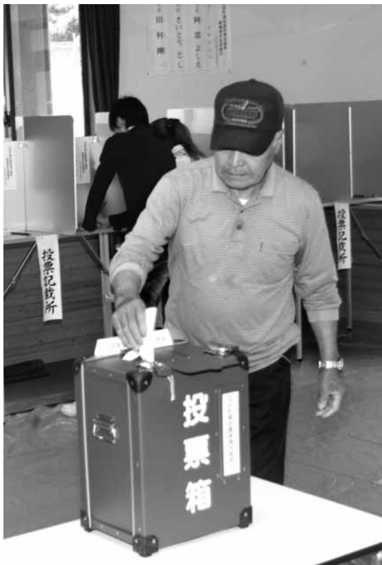
選挙はわたしたちに与えられた大切な権利。棄権せず必ず投票しましょう（ことし7月に行われた町長選挙の投票風景・旧さくら幼稚園）