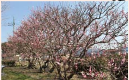
4月中旬、見頃を迎えた大沢の臥竜梅