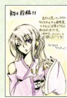
アビエもん (船越・14)