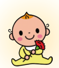
長門 怜 佑 (長崎・三喜男・男)