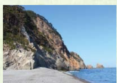
「澁磯海岸に行ってきました」 山の内弁当 (船越・?)