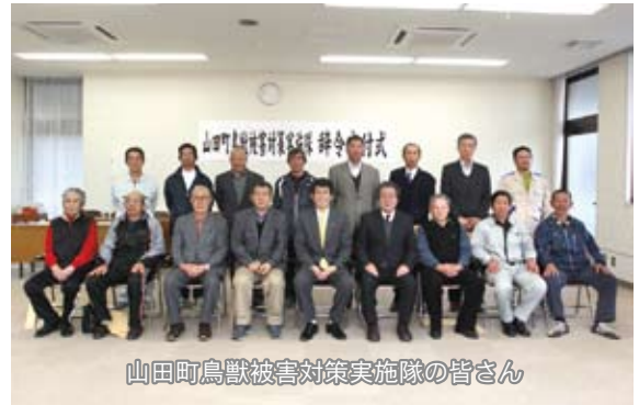
山田町鳥獣被害対策実施隊の皆さん

また、ツキノワグマについては昨年度6頭の有害捕獲実績がありますが、今年度はブナの実が凶作である予測をもとに県がツキノワグマ出没注意報を発令しており、例年に増して大量出没が懸念されています。町民の皆さんにも廃棄野菜や生ごみなどの、クマを誘発する物を家の外に放置しないことや、必要時以外はできるだけ山に近づかないことに注意してもらおうほか、鳥獣被害対策実施隊としても、見回りや追い払い、緊急時の捕獲など、被害防止に全力で取り組んでいきます。