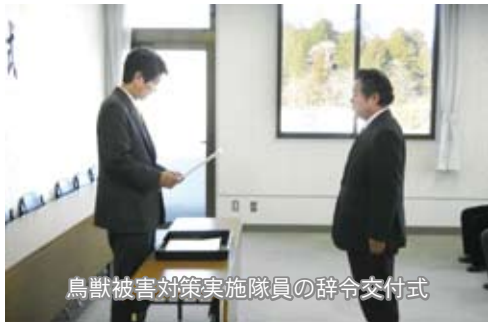
鳥獣被害対策実施隊員の辞令交付式

最近、野生鳥獣による農林水産物等への被害が拡大し深刻な問題となっております。 町では、ツキノワグマやニホンジカなどの有害鳥獣の捕獲など、被害防止対策事業について猟友会との連携を強化し推進していくために、4月1日より山田猟友会員23人を非常勤職として鳥獣被害対策実施隊員に任命しま