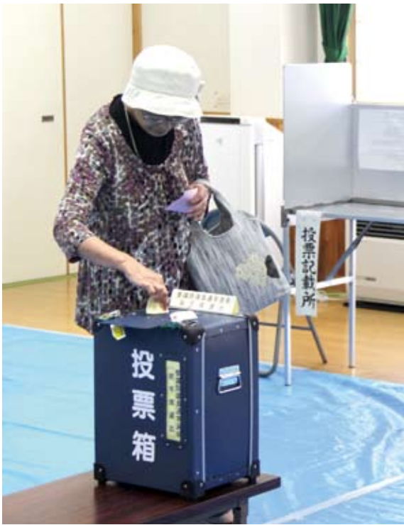
選挙はわたしたちに与えられた大切な権利。棄権せず必ず投票しましょう（昨年7月に行われた参議院議員通常選挙の投票風景）