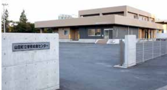
学校給食センター建設工事費