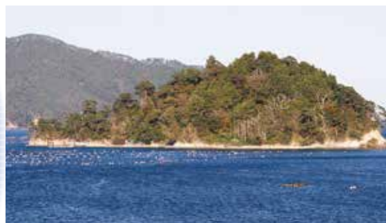
オランダ島整備工事費