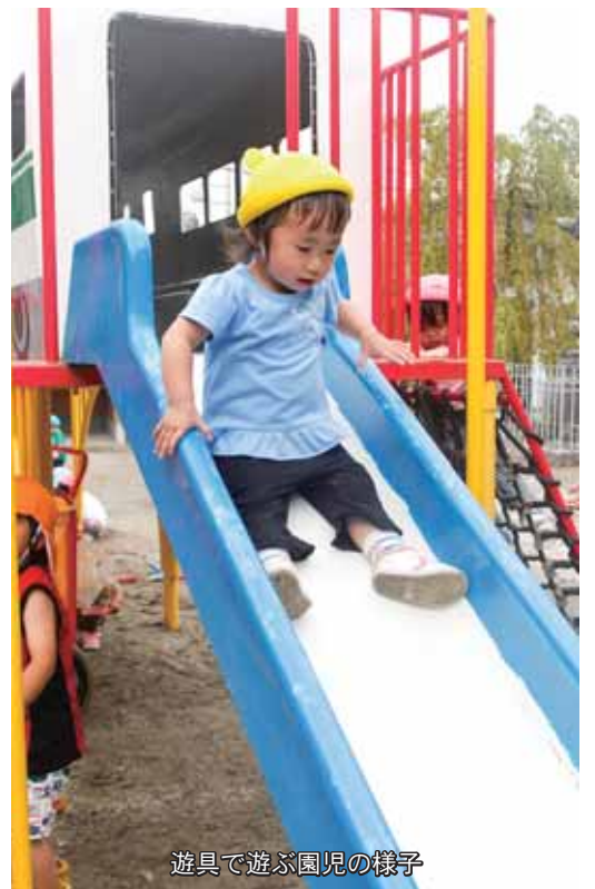
遊具で遊ぶ園児の様子

町内の幼稚園・保育園は、就学前児童の教育・保育を担っておりますが、少子化の問題に加え、施設の老朽化も課題となるなど、町全体として幼児教育・保育施設のあり方を考える時期