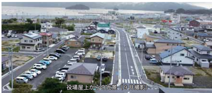
役場屋上からの光景（9月撮影）

現在、町民の皆様のご協力をいただきながら「総合計画後期基本計画」の策定に取り組んで