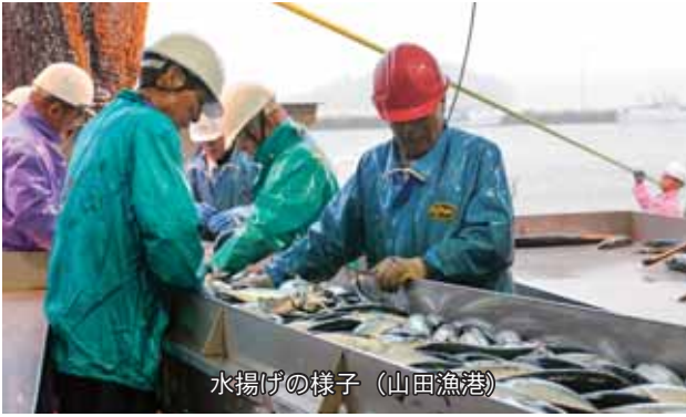
水揚げの様子（山田漁港）

つくり育てる漁業の推進や漁業担い手の育成に注力することに加え、県や漁協などと連携しながら、新たな増養殖技術の確