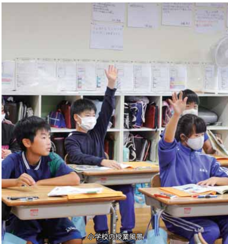
小学校の授業風景

ことができない施設であると同時に、避難所としての重要な役割も担っております。大沢ふるさとセンターは、供用開始から約40年経過し、老朽化が著しいことから、新たな施設として整備を進めてまいります。