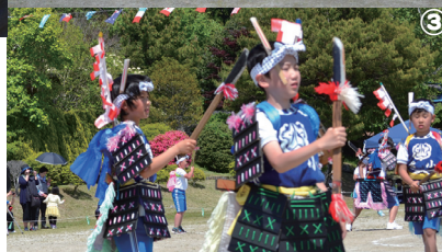
①新巻鮭作り②盆踊り 1③北小剣舞 1④北小剣舞 2⑤盆踊り 2⑥まごころフェスティバル