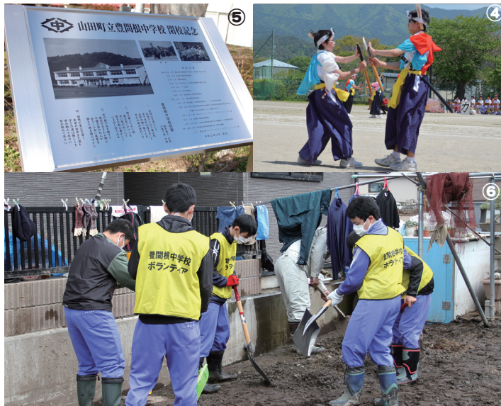
①大浦さんさ踊り②運動会の綱引き③シイタケ収穫体験 ④ホタテたたき体験⑤閉校記念碑