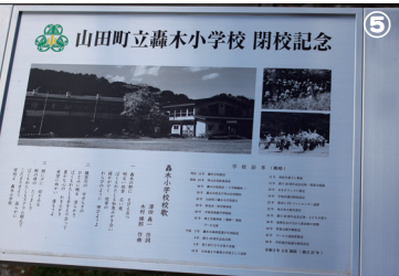
①シースマイル山田湾②サケ稚魚放流③織笠八木節④織笠大橋花植え⑤閉校記念碑