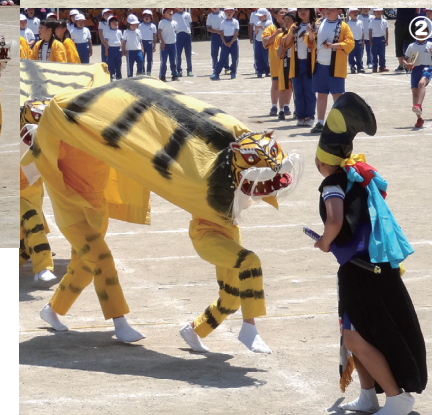
①南小虎舞 1②南小虎舞 2③鼓笛隊④閉校記念碑⑤南小虎舞 3