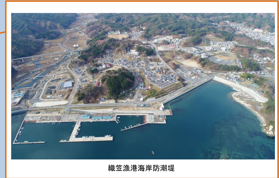
織笠漁港海岸防潮堤