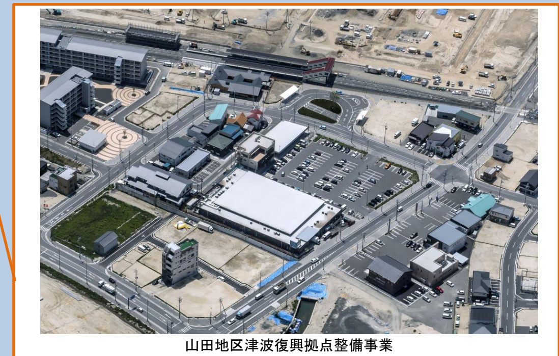
山田地区津波復興拠点整備事業