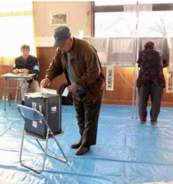
自らの意思を示すために一票を投じる有権者(昨年の第47回衆院選)