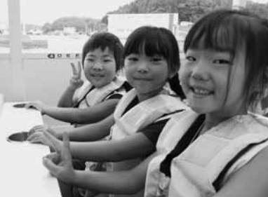
まちかどスナップ