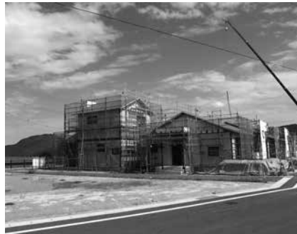
建設が進む織笠跡浜団地

28-1392 山田町八幡町3番20号 ☎82-3111 内線341、343) へどうぞ。