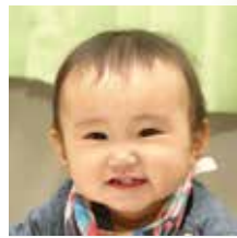
昆 倅 菜 （織笠・和矢・女）