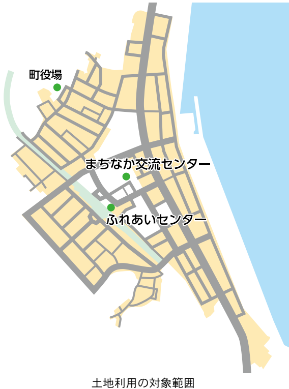
土地利用の対象範囲