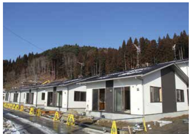
建設が進む大沢小学校協団地

◆申込先・問い合わせ 町建築住宅課建築住宅係(☎82-3111内線341、343)へどうぞ。