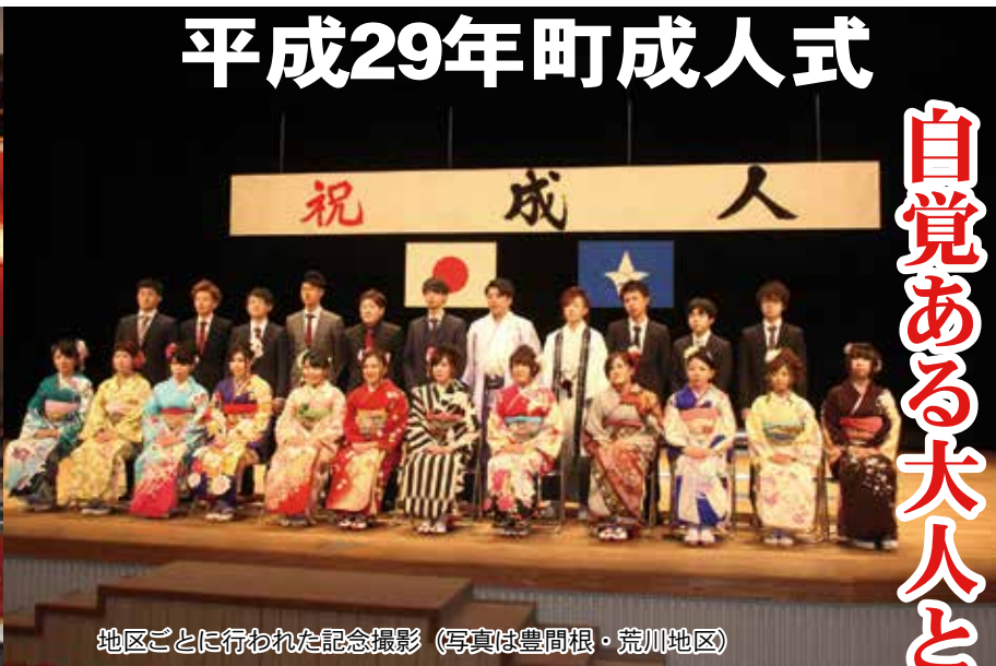
地区ごとに行われた記念撮影（写真は豊間根・荒川地区）