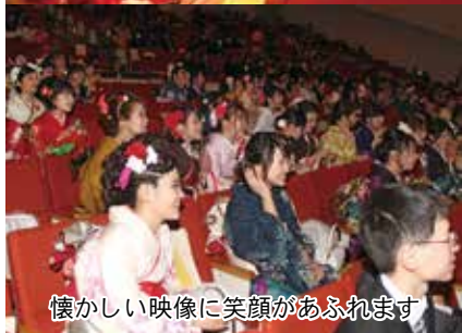
懐かしい映像に笑顔があふれます