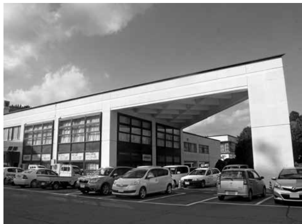
健康子ども課が設置される保健センター