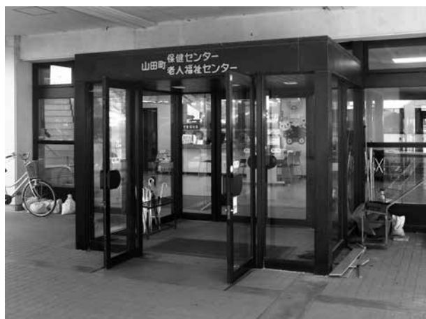
入口はこちらです