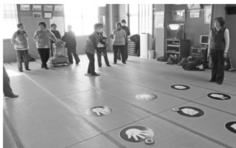
楽しく介護予防しませんか