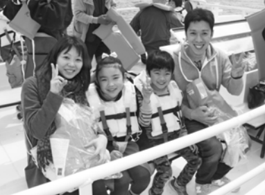
家族でカキまつりに行ったよ