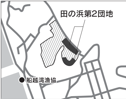
田の浜第2団地位置図