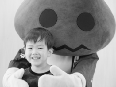
まっついと笑顔で2ショット