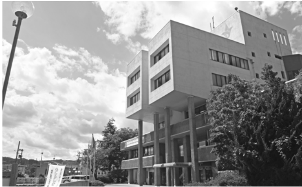
町のために働きませんか

・土木技師：1人程度 ・土木技師(民間等経験枠)：1人程度 ・保健師：1人程度 ・保育士：1人程度