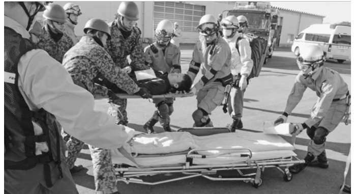
防災関係機関の訓練も見学できます(一昨年時の訓練の様子)