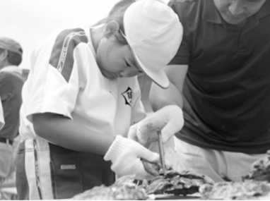
大浦小の漁業体験