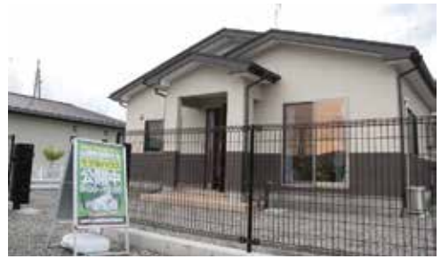
山田型復興住宅モデル住宅工事費