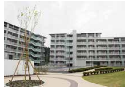
災害公営住宅整備費