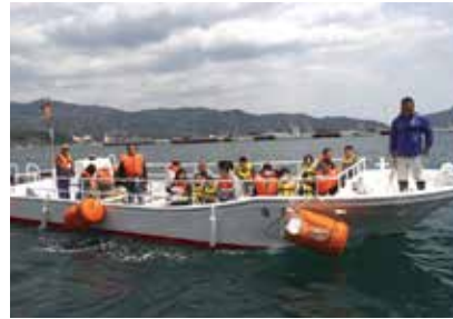
11m型アルミ合金製旅客船建造工事費