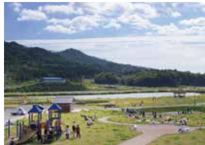
船越公園災害復旧工事費