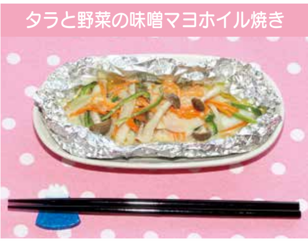
【料理に含まれるエネルギーと塩分 (一人あたり)】 エネルギー…191kcal カロリー 塩分…1.8g

※水が蒸発して少なくなったら足してください。 ◆ポイント◆ オープンやトースターがなくても、フライパンで簡単に作ることができます。淡白なタラに、味噌マヨネーズがよく合います。