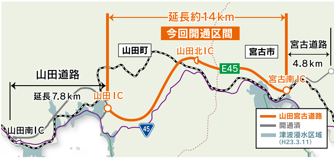
山田宮古道路の位置図