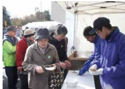
特産品のお振る舞いは大盛況