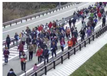
自動車専用道路をウォーキング