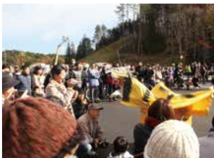
堂々とした演舞を披露