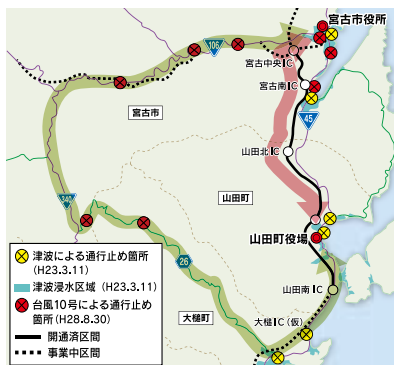
三陸沿岸道路ルート（ピンク）と う回路（緑）

（IC）（仮）―山田南ICが30年度、釜石北IC―大槌IC（仮）が31年度に開通予定で、32年度の全線開通を目指しています。