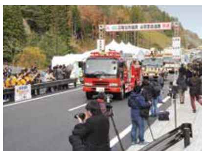
開通パレード盛大に