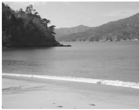
美しく穏やかな荒神海岸（上写真）／しかし、付近の山道に一步足を踏み入れると、一部の心無い人により不法投棄された廃棄物が散乱していました＝昨年3月の環境美化ウォーキングの際に撮影＝