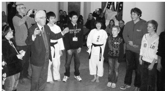
ザイスト市C.L.Z.校との交流の様子（本年1月のジュニア海外使節団）

山田町とオランダ王国ザイスト市との友好都市締結から10年という節目を祝い、駐日オランダ王国公使をはじめとする関係者をお招きして記念行事を開催します。