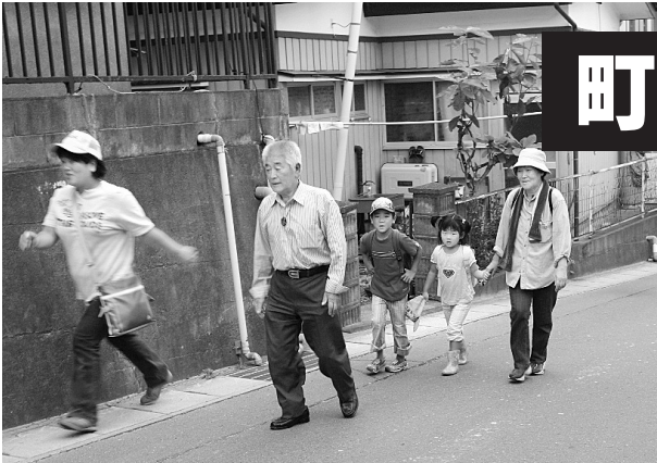
昨年の同訓練の様子 (境田地区での津波避難訓練)