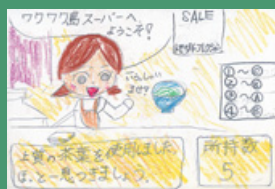
トモコしゅうかピー(12)