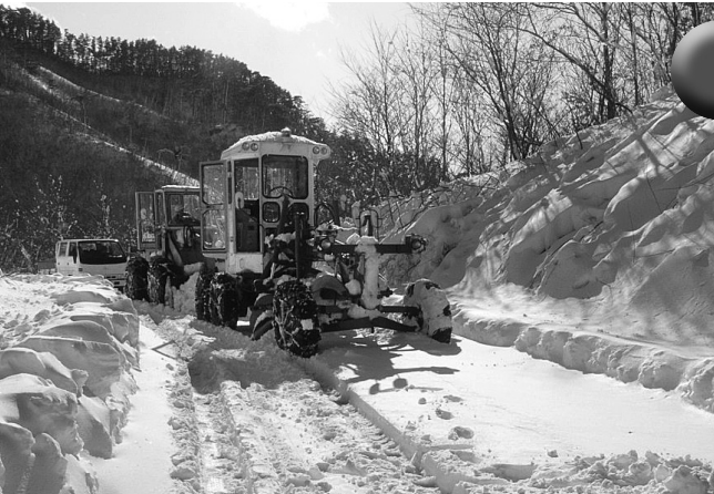
昨年の除雪作業の様子（瀧磯地区）