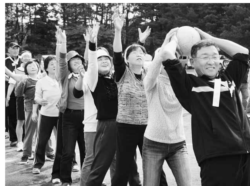
元気で健康な暮らしを送るためにも、生活習慣病の予防に努めましょう（昨年の町民体育祭）

4月から始まる後期高齢者医療制度と特定健診・特定保健指導。昨年10月1日号から6回にわたり、新しい制度についてご紹介してきました。最終回となる今回のテーマは特定保健指導。特定健診でメタボリックシンドローム（内臓脂肪型症候群）の該当者や予備軍と診断された方に対して、生活習慣の改善をサポートします。