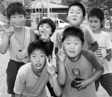
まちで出会ったかわいい笑顔