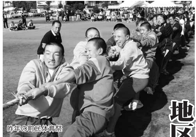
昨年の町民体育祭