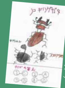
やまゆきゆうしん(5)