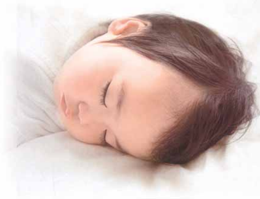
◆本町の児童虐待相談件数