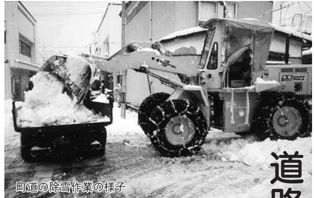
町道の除雪作業の様子