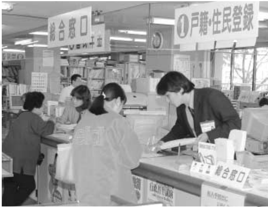
昨年8月に第1次サービスが始まった住民基本台帳ネットワークシステム。8月25日から第2次サービスが開始し住民サービスの向上が図られます(役場町民課の窓口の様子)

住民基本台帳ネットワークシステム(以下「住基ネット」)の第2次サービスが八月二十五日から始まります。昨年八月に第1次サービスが開始され、行政機関の一部の事務で申請や届け出に住民票の写しの添付などが不要になりました。第2次サービスでは、全国どこの市区町村からでも住民票の写しが取れるようになるほか、住民基本台帳カード(以下「住基カード」)の交付が受けられるなど、住民サービスの向上と行政事務の効率化が図られます。今号では、住基ネット第2次サービスの概要についてお知らせします。