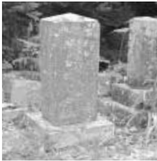
龍昌寺にある貫洞定次郎の墓碑。「治一次」のどちらの字も刻まれています（右）。「岩手県議会100年の歩み」の名簿より抜粋。明治12年に東閉伊郡選挙区から3人が当選しています（上）

町長）らが中心となり、同志を集い自由民権運動を推進した。明治二十三年七月第一回衆議院議員（有権者は国税十五円以上納入、二十五歳以上の男子）選挙が行われた。本県は五区、定員五名。第二区（東・中・北閉伊郡、南・北九戸郡）から小田為綱（九戸）、中原貞七（盛岡）、伊東圭介（盛岡）が立候補。弁護士、求我社系の自由党员で舎定らと自由民権運動を推進してきた伊東が多く、支持を得当選した。