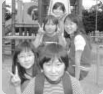
まちで出会ったかわいい笑顔

町のホームページアドレス http://www.town.yamada.iwate.jp/