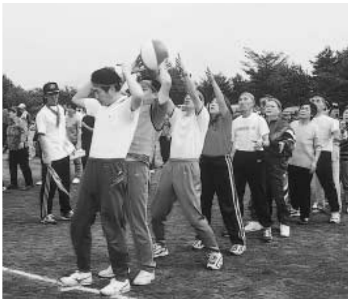
老後の安心を支える国民年金。若いうちから保険料を納め続け大切な受給権を守りましょう。