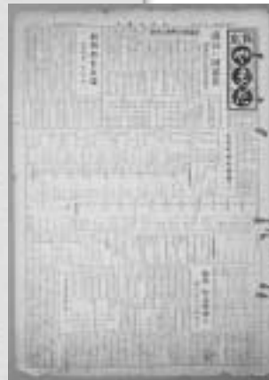
「広報やまだ」創刊号