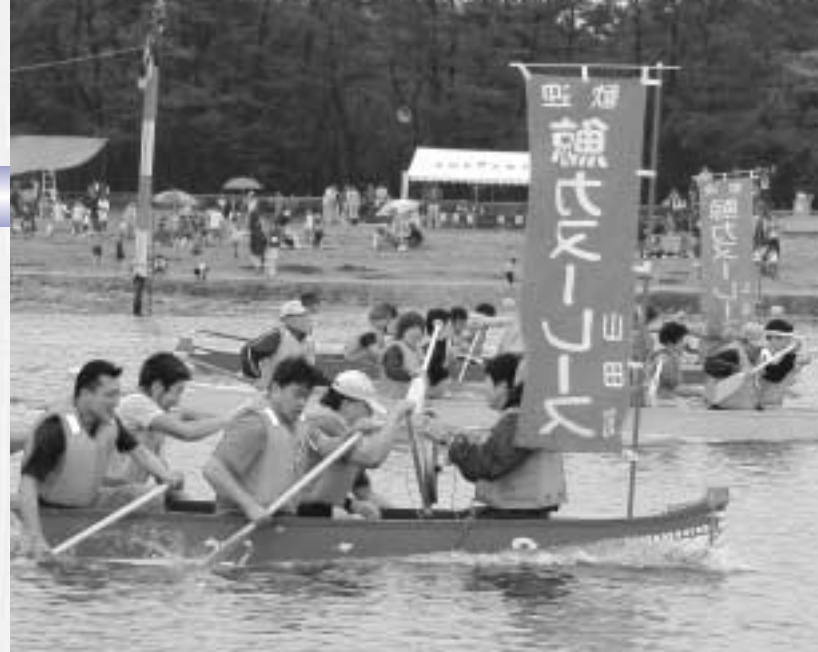
水しぶきを上げて海面を快走する鯨カヌー