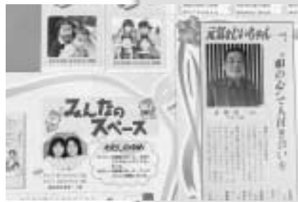
今年4月に始まった新しいコーナー