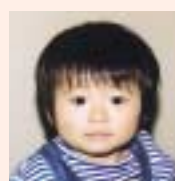
港 海夏人 (船越・克洋・男)