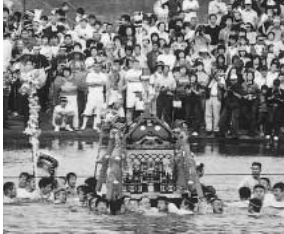
担ぎ手が海に肩まぐさり勇ましく練り歩く大杉神社の海上渡御