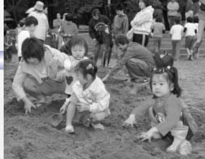
宝探しで、砂まみれになりながら宝の入った袋を探す子供たち(写真上) / オープニング行事では、えびすまきが行われ、投げ込まれるお菓子などを取り合っていました(丸写真)

第23回「山田ビーチフェスティバル」が7月20日、浦の浜海水浴場で開かれ、1,000人の家族連れなどでにぎわいました。砂浜では宝探しやビーチサンダル飛ばしなど多彩なイベントが繰り広げられ、親子で砂を掘り起すなど仲むつまじい光景が広がっていました。海上ではフェスティバルのメインイベント「鯨カヌーレース」を開催。今年から新たに設けられた小学生の部には6チームがエントリーしたほか、一般の部には町内外から13チームが参加し、観客の声援を浴びながら熱戦を展開しました。結果、一般の部は「鯨ヶ崎ファイターズ」(宮