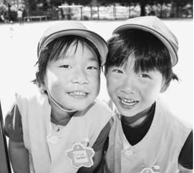
まちで出会ったかわいい笑顔