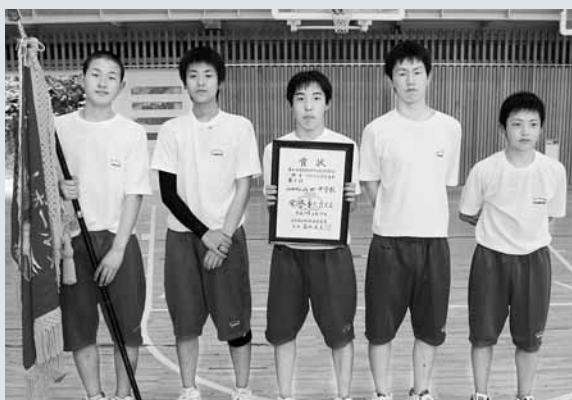
初のアベック優勝を果たした山中バスケット部の皆さん

バスケットボール男子は、予選を順調に勝ち進み、決勝戦で宮古一中と対戦。接戦となりましたが、62-55で勝利を収め、初優勝に輝きました。また、女子も地区大会4連覇を達成しており、バスケット