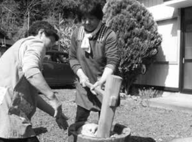
よもぎ餅の餅つき (春の山菜まつり)