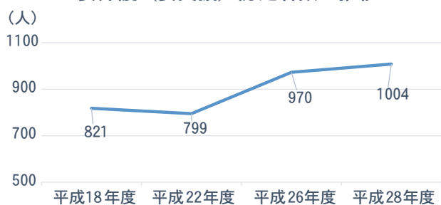
要介護（要支援）認定者数の推移

下のグラフは町内の要介護（要支援）認定者数の推移をまとめたものです。平成18年度に821人だった認定者は、28年には1004人となっており、増加傾向が見られます。今後も高齢化が続いていく本町。介護予防は、町の喫緊の課題です。