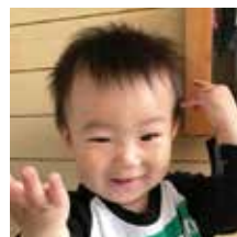
佐 藤 欄 （山田・男・陽介）