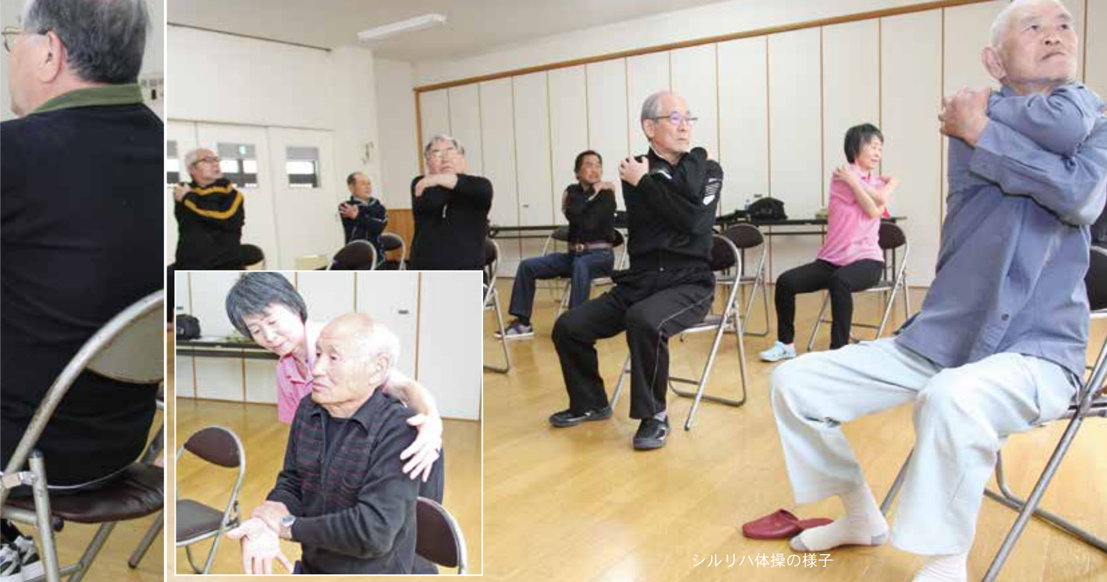
シルリハ体操の様子