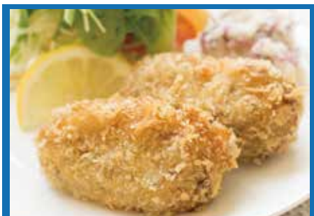
ビターバレン ..... 800円

日本でいうコロッケに近いオランダの定番料理「ビターバレン」を、山田の旬の魚介を具材に使って提供します！