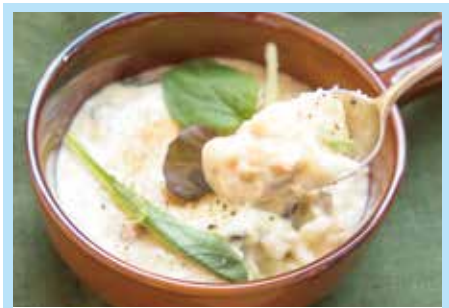
赤血貝としゅうり貝のビスパネチェ 700円

住 所 岩手県下閉伊郡山田町長崎1-8-18 T E L 0193-82-2658 営 業 ランチ 11:30~13:30 ディナー17:30~21:30 定休日 不定休