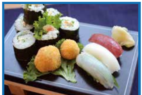
日蘭おしプレート ..... 1,000円

住 所 岩手県下閉伊郡山田町川向町7-5 T E L 0193-82-2306 営 業 11:00~21:00 定休日 不定休