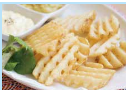
ポテトフライ ..... 400円

住 所 岩手県下閉伊郡山田町中央町6-17 T E L 0193-82-4960 営 業 ランチ 11:30~14:00 ディナー17:00~22:00 定休日 火曜