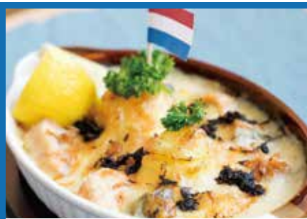
オラぼのビスパネチェ ..... 850円

住 所 岩手県下閉伊郡山田町中央町8-9 T E L 080-5741-5719 営 業 17:00~23:00 定休日 月曜