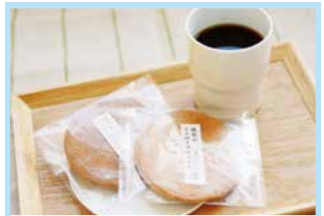
ストローワッフルセット ..... 555円

住 所 岩手県下閉伊郡山田町川向町6-43 T E L 0193-82-3510 営 業 ランチ 11:30~14:30 ディナー17:00~22:30 定休日 月曜