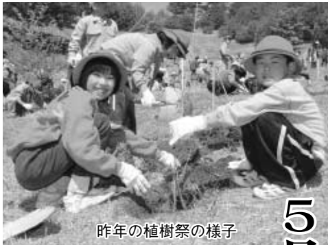
昨年の植樹祭の様子

町のホームページアドレス http://www.town.yamada.iwate.jp/