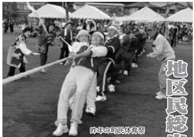
昨年の町民体育祭