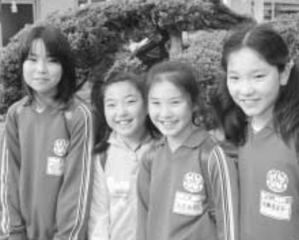
まちで出会ったかわいい笑顔