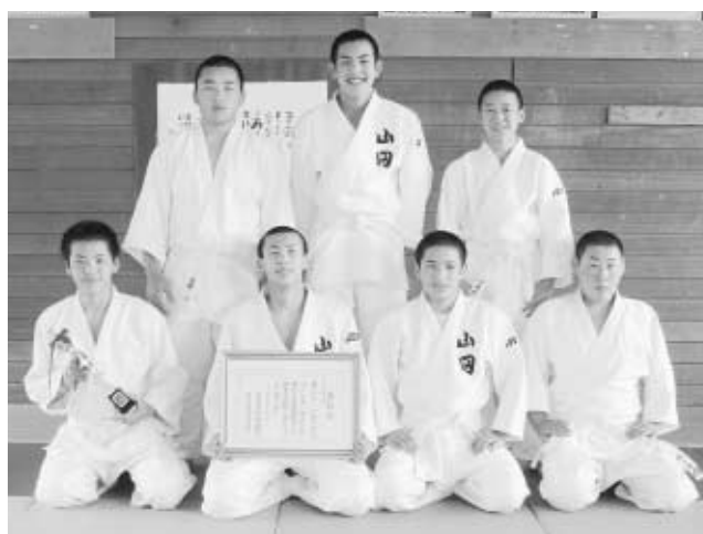
3位入賞の喜びに沸く山中柔道部男子の皆さん

町のホームページアドレス http://www.town.yamada.iwate.jp/