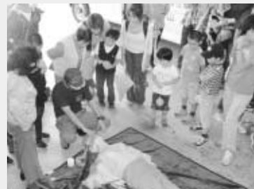
応急手当を学びませんか（昨年9月の応急セミナーの様子）