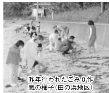
昨年行われたごみ0作戦の様子(田の浜地区)