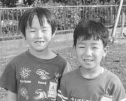
まちで出会ったかわいい笑顔