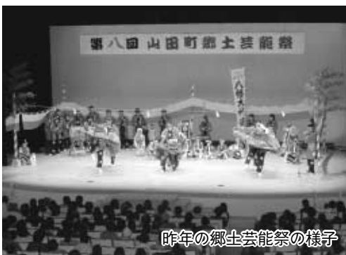
昨年の郷土芸能祭の様子

町のホームページアドレス http://www.town.yamada.iwate.jp/