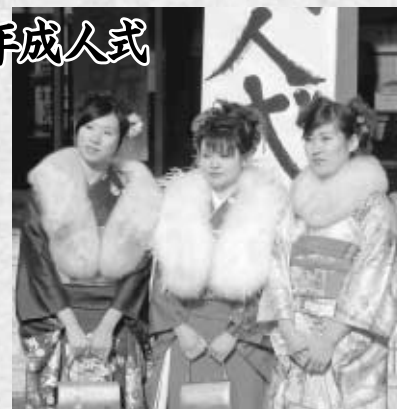
昨年の成人式の様子

新成人を祝い励ます「平成18年山田町成人式」が開かれます。該当する方は、昭和60年4月2日から61年4月1日までに生まれ、本町に住所がある方です。ただし、学生や仕事の都合などで町外に住んでいる方でも参加できますので、希望する方がありましたら、11月25日までに町中央公民館へご連絡ください。