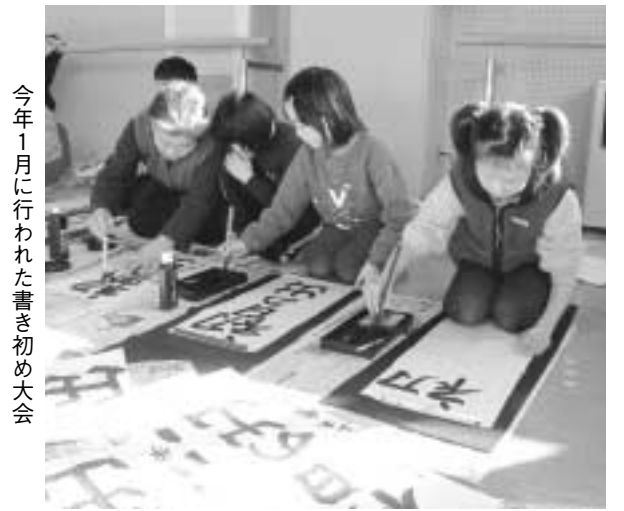
今年1月に行われた書き初め大会