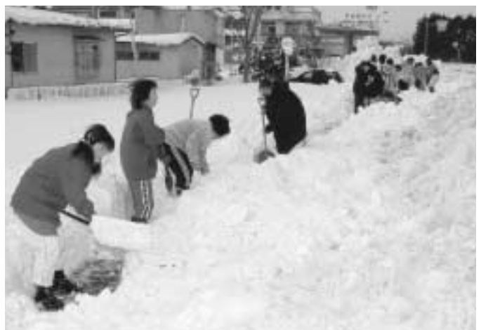
突然の大雪に対処していくためには地域の皆さんの協力が必要です(歩道を雪かきする船越地区の皆さん)

日陰や坂道など路面が凍結し滑りやすい所には、滑り防止のための「カラミ」や融雪剤が備え付けてあります。道路の状況に応じ、凍結している場所にまでご利用ください。「カラミ」