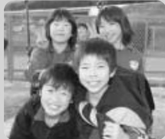
まちで出会ったかわいい笑顔