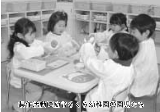
製作活動に励むさくら幼稚園の園児たち