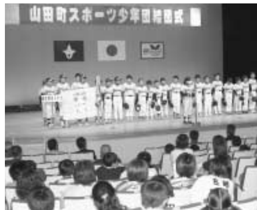
多くの子どもたちがスポーツ少年団の活動を通じ、心と体を鍛えています