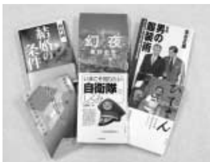
今月紹介する新刊・新着図書