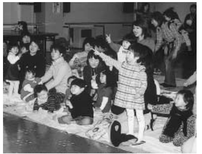
学習会を通じて、お母さん方の子育てを支援します

たんぼぼ学級では、お父さんやお母さん方に安心して学習していただくため、託児室で子供たちの世話をさせていただきます。