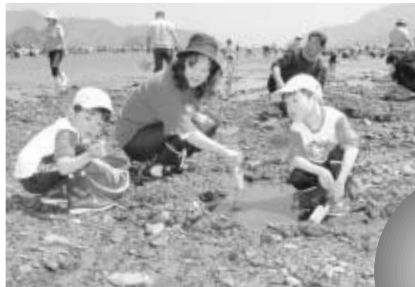
みんなでアサリまつりに出掛けませんか(昨年と同まつりより)