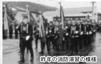
昨年の消防演習の様

町消防演習が行われます。当日は山田南小学校と大浦地区を会場に、消防団員の模擬火災防御訓練や分列行進、大浦漁協婦人部消防協力隊による初期消火訓練などを実施します。どうぞご観覧ください。