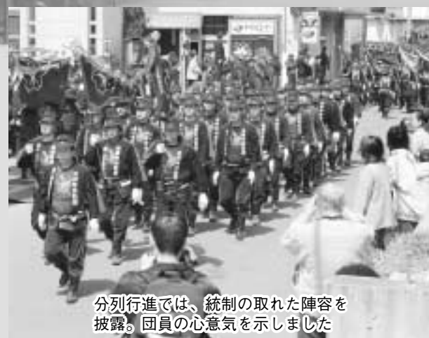
分列行進では、統制の取れた陣容を披露。団員の心意気を示しました