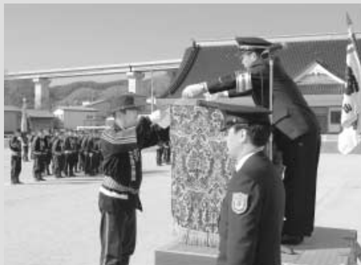
開会行事では各種表彰が行われました