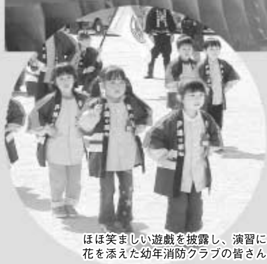
ほほ笑ましい遊戯を披露し、演習に花を添えた幼年消防クラブの皆さん

一町長が「急速に進展する社会環境の変化と多様化する各種災害に即応するため、消防団が担うべき役割は極めて重要となってきています。団員の皆さんには、今後も地域に根ざした活動を展開しながら、町民が安全で、安心して暮らせる地域づくりのため、一層努力を重ねてほしい」と訓示しました。