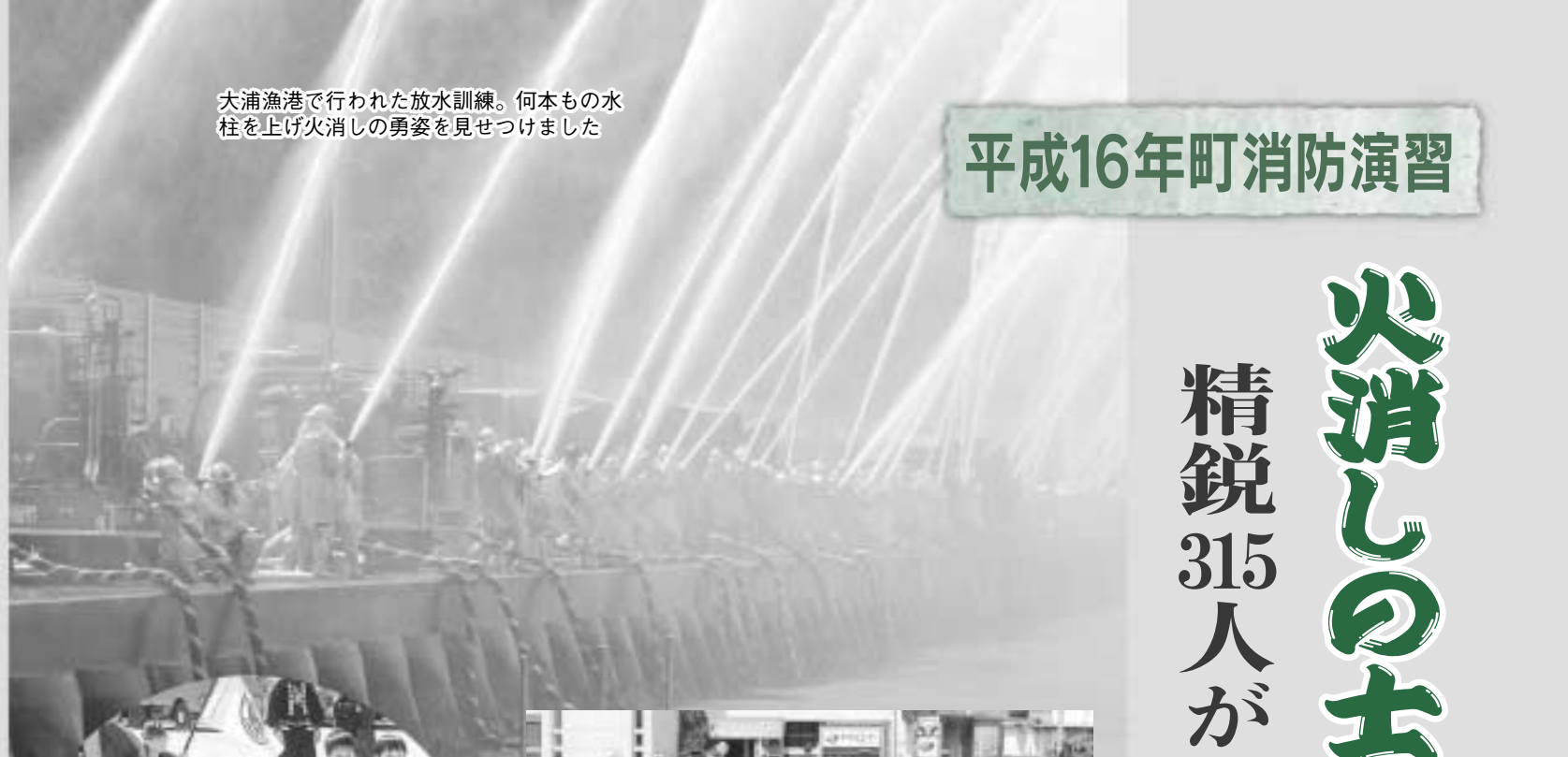
大浦漁港で行われた放水訓練。何本もの水柱を上げ火消しの勇姿を見せつけました