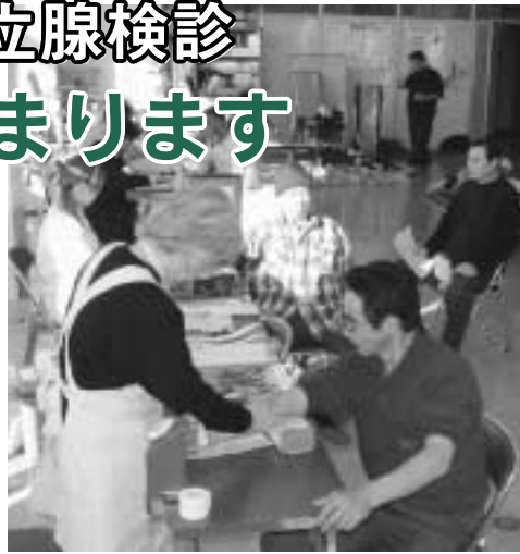
定期的な検診を心掛けましょう(今年1月に行われた出稼ぎ者の健康検診)

循環器と前立腺、基本検診が表の日程で行われます。受診の申し込みをしている方は、受診料を持参し、忘れずに受診料をください。まだ申し込みをしていない方でも受診できますので、希望する方は当日検診会場までお越しください。 また昨年同様、循環器検診でC型肝炎ウイルス検査を行います。対象は、検診日現在の年齢