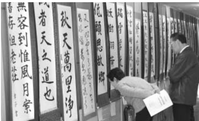
昨年の町民芸術祭展示部門の様子

町民の芸術作品や文化活動を発表する町民芸術祭が、十月三十一日の「民謡と踊りの集い」を皮切りにスタートします。日程は左表のとおりで、約一カ月間にわたり町中央公民館、中央コミュニティセンター、保健センターを会場に開かれます。豊かな個性ときらめく感性で表現される「町民芸術祭」。今年も日ごろの創作活動や練習の成果から生まれた