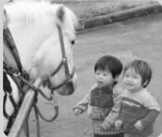
まちで出会ったかわいい笑顔

町のホームページアドレス http://www.town.yamada.iwate.jp/