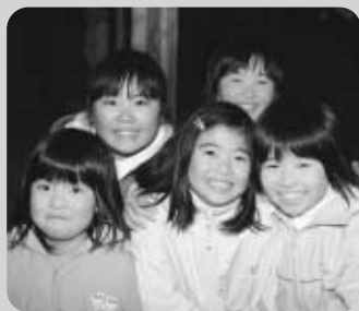
まちで出会ったかわいい笑顔