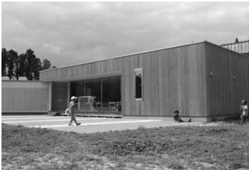
寄贈されたオランダ島ハウス

「復興『ありがとう』ホストタウン」とは、2020年東京オリンピック・パラリンピックに向けて「復興五輪」の機運を盛り上げようと、東日本大震災の被災3県（岩手県、宮城県、福島県）の自治体が、被災時に支援していただいた参加国・地域を招き交流するというものです。昨年9月に国が創設した制度で、国の支援を受けながら実