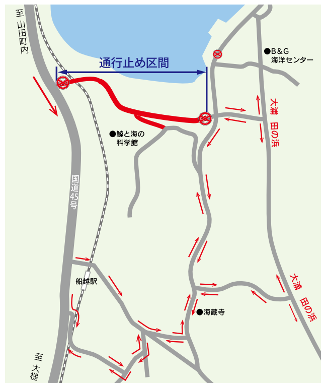
長林・大浦線通行止め箇所