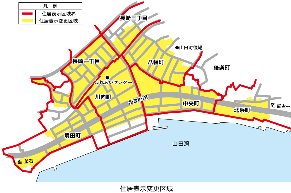
住居表示変更区域

山田地区は、震災復興土地区画整理事業などで道路などの位置や形状が変わりました。これに伴い町では、分かりやすい住所の整備を目的に住居表示を実施します。