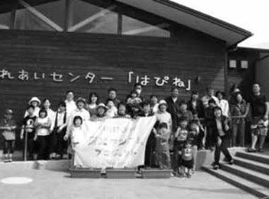
花いっぱい大作戦 「掛け声は1、2のサントリー！」