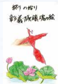
投稿者 田代 美智代