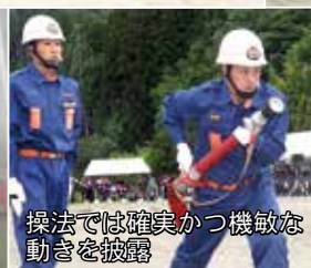
操法では確かかつ機敏な動きを披露