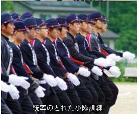
統率のとれた小隊訓練

6月10日、柳沢地区で平成30年山田町消防演習が行われました。主会場となった山田北小学校の校庭には関係者ら約450人が来場。山田を守る消防団の特別訓練の様子に、大きな拍手が送られました。今号では、演習の様子を組み写真でお伝えします。