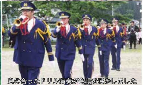
息の合ったドリル演奏が会場を沸かしました