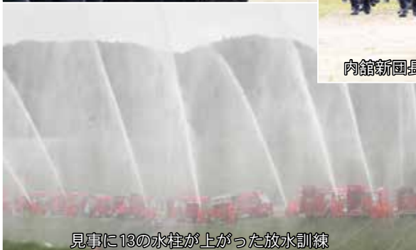
見事に13の水柱が上がった放水訓練