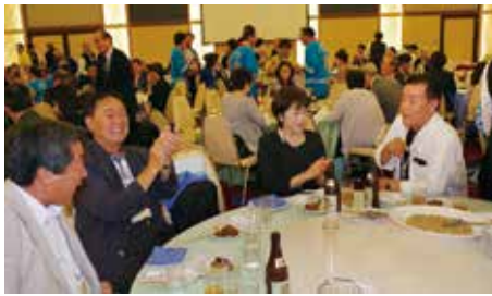
参加者からは笑みがこぼれます