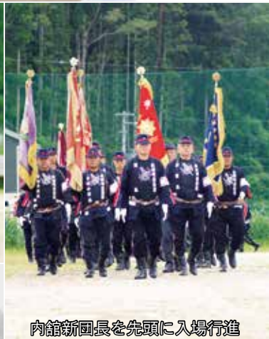
内館新団長を先頭に入場行進