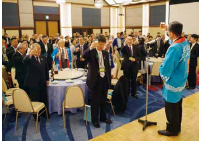
乾杯で懇談がスタート