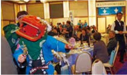
八幡大神楽が舞を披露