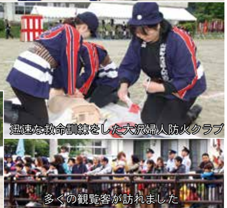
迅速な救命訓練をした大沢婦人防火クラブ