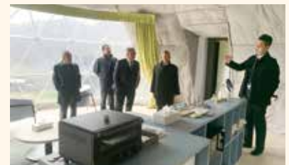
グランピング施設 内部 →