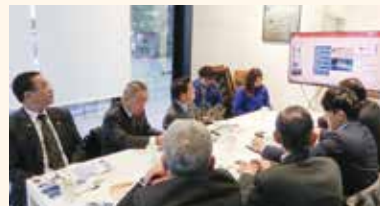
社内での 視察研修 ←

北三陸ファクトリーでは、磯焼けによる餌不足で痩せたウニを畜養し、美味しいウニとして商品に変える取組を行っています。また、令和7年4月よりウニ陸上養殖システムの構築に向けて、国の事業を活用して実証事業の本格化に取り組んでいて、現在洋野町内に大規模陸上養殖施設を建設中です。