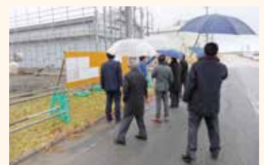
建設中の 陸上養殖施設外観 →