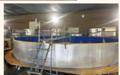
陸上養殖 施設内部 →