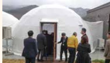
グランピング施設 外観 ←

岩泉町では平成28年台風10号豪雨災害で被災した交流施設「ふれあいランド岩泉」を再整備し、令和7年4月24日に新たな観光施設として「シンバルス」がグランドオープンしました。再整備にあたっては、グランピング施設やコテージの建築、サニタリーハウスのリフォーム、オートキャンプ場の区画拡大、東屋設置などを実施しました。特徴として、持続的な管理運営を図ることを目的に民間の活力を導入しており、町が決定した事業者が施設設計や施工などを行い、完成後は指定管理者となって管理運営を行っています。